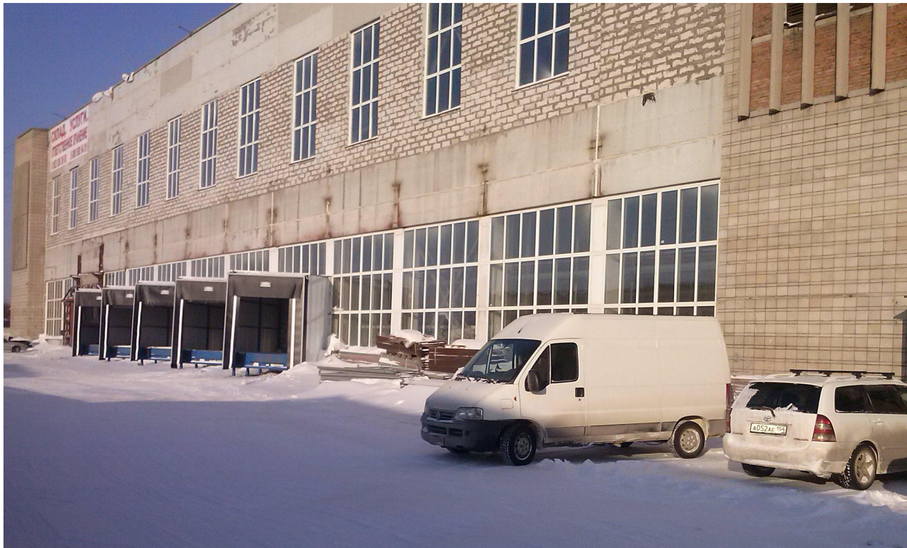
ФОТО ПРЕЗЕНТАЦИЯ ТЕРМИНАЛА